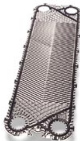
Пластина Clip Gemini