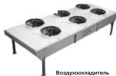
Воздухоохладитель большой мощности