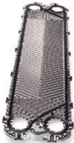
Пластина Clip Standard

Наличие двойных стенок позволяет пластинам Gemini сочетать оптимальную теплопередачу с более высоким уровнем защиты от смешивания жидкостей.