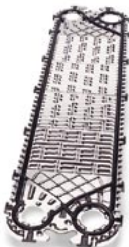
Пластина Clip Widestream